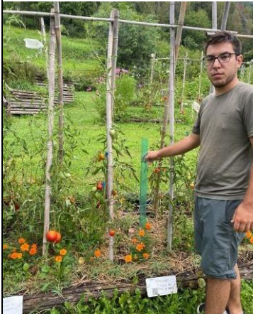
Pianta in coltura