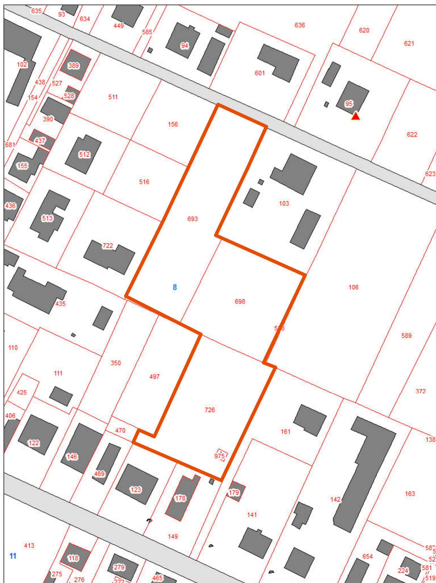
0 12,5 25 50 75 100 Meters