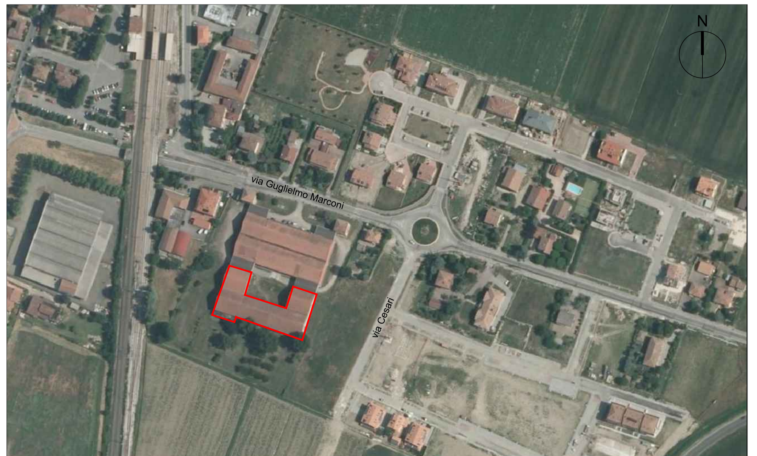
INQUADRAMENTO AEROFOTOGRAMMETRICO SCALA 1:2000