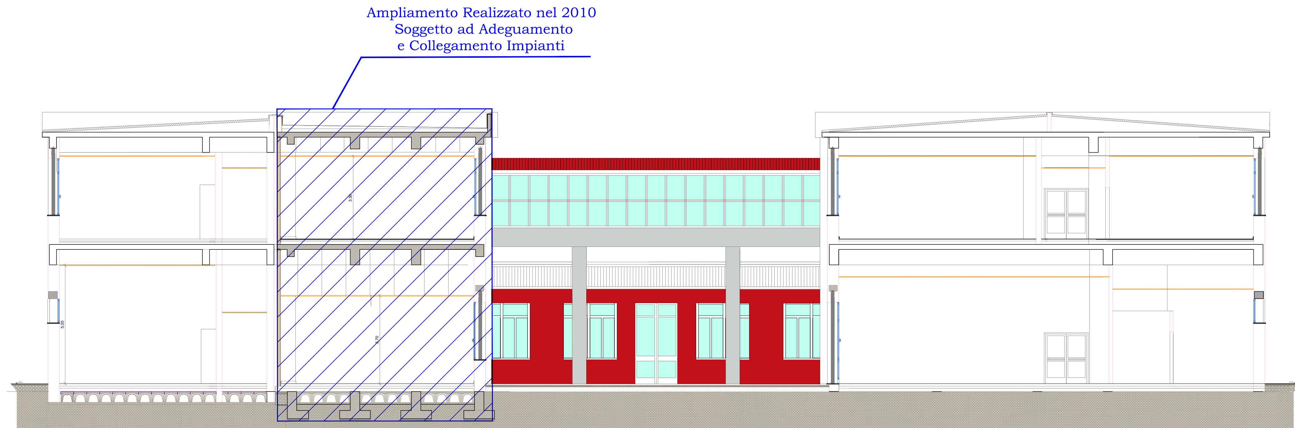
SEZIONE A - A