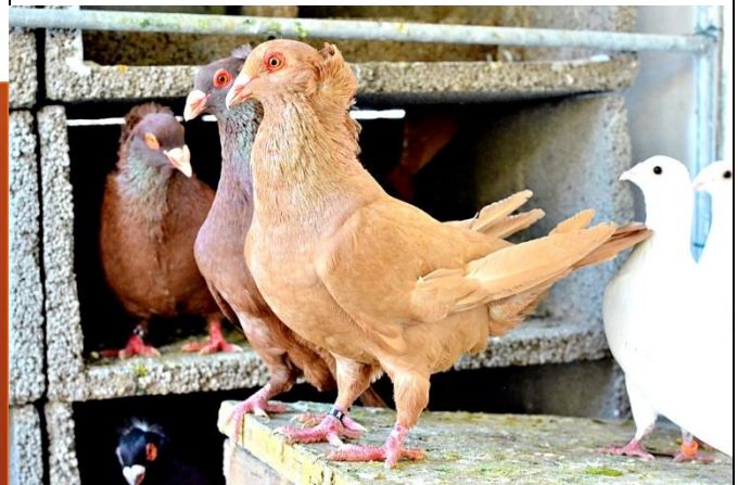
Colombo nero da Magnano