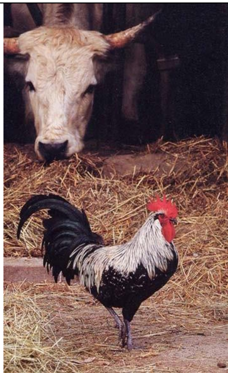
Betulla argento maschio