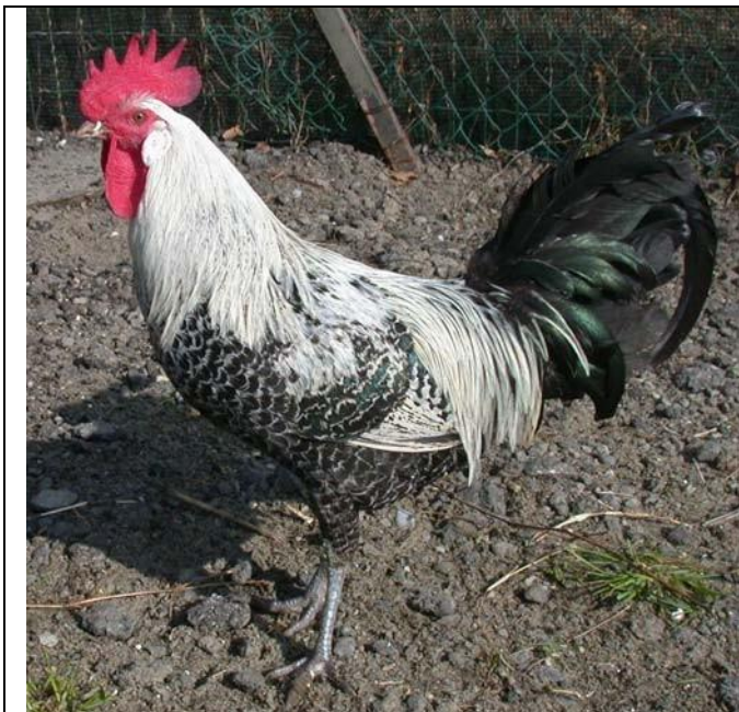
Moschettato argento maschio