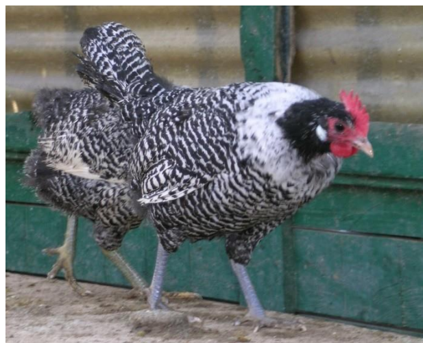
Moschettato argento testa di moro femmina