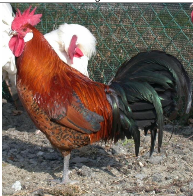
Moschettato oro maschio