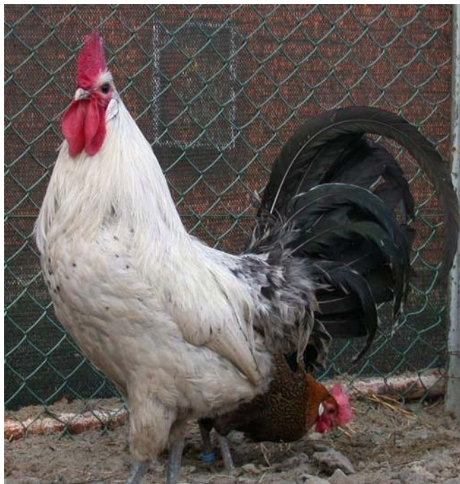
Fiocato argento maschio