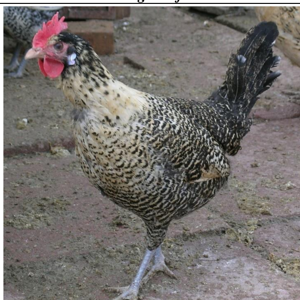
Moschettato limone testadi moro