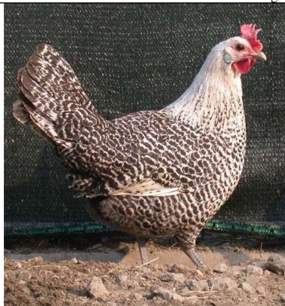
Moschettato argento femmina