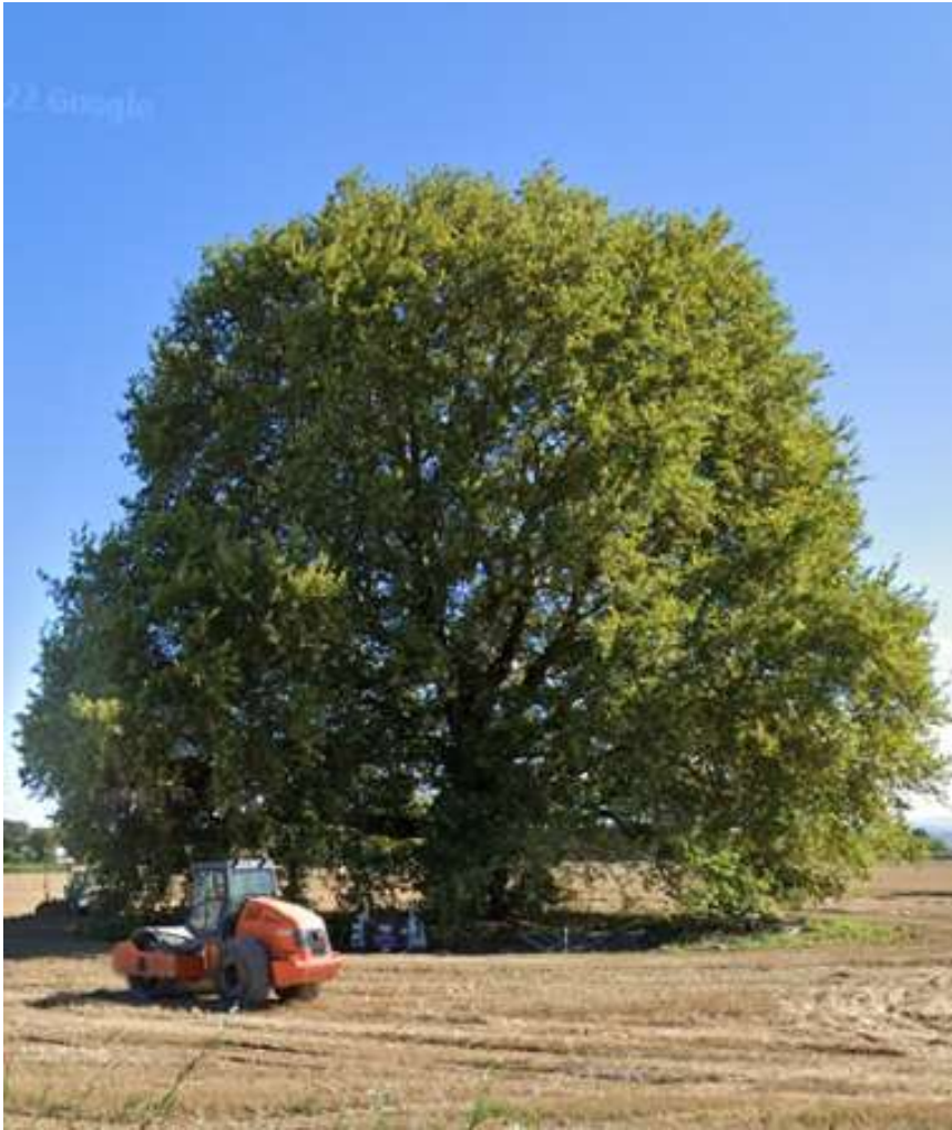
Vista 1 estate