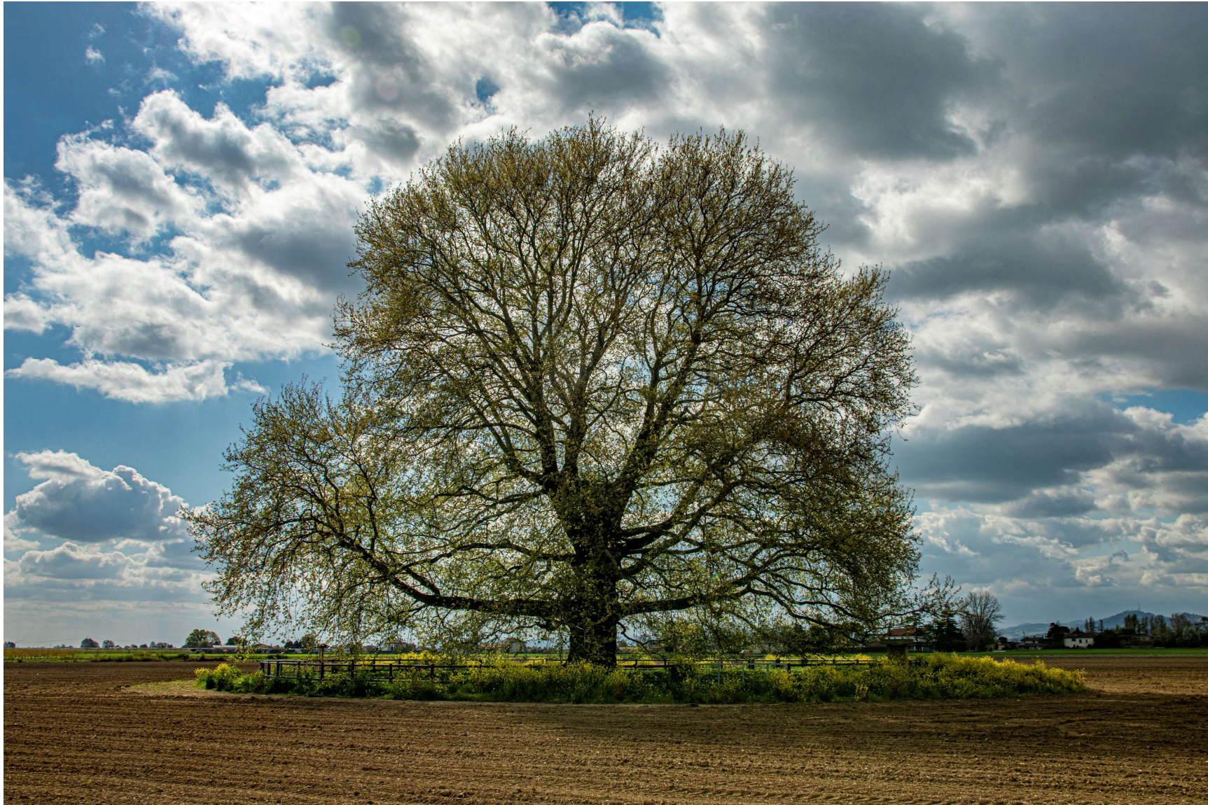
Vista 1 primavera