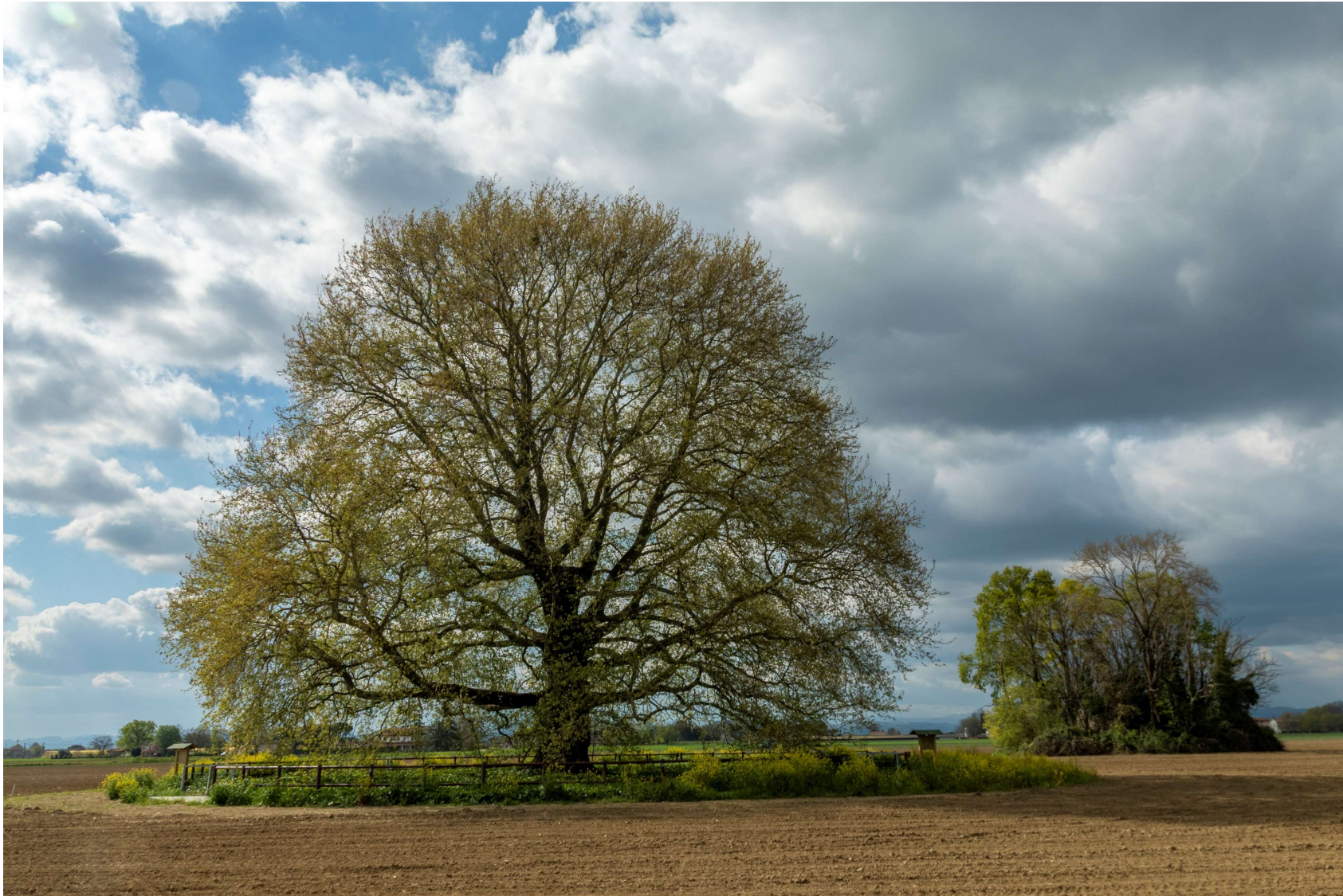
Vista 2 Platano e ghiacciaia