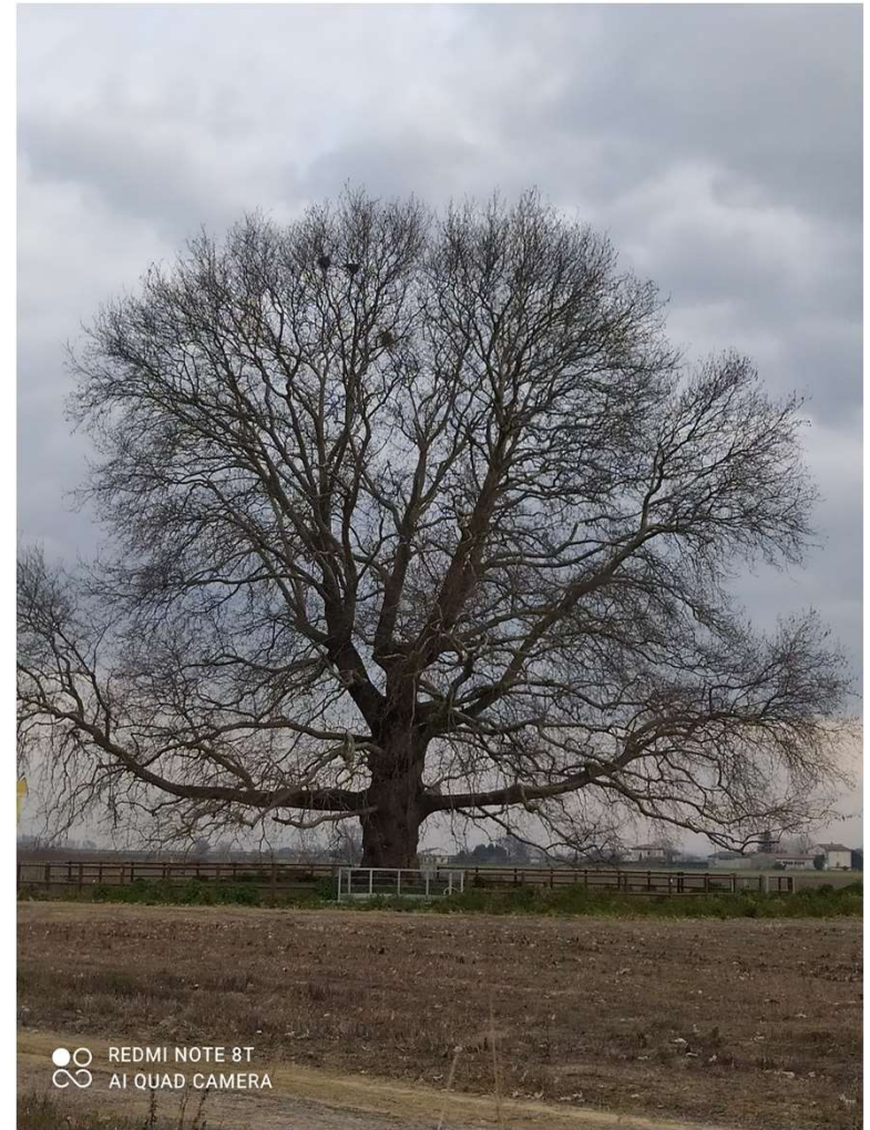
Vista 1 inverno