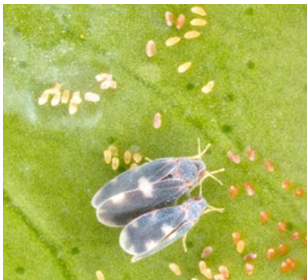
Figura 1 - Adulti e uova di Aleurocanthus spiniferus

In Emilia-Romagna le prime segnalazioni risalgono all'estate 2018 e sono concentrate pur con diversi livelli di gravità, nella parte centro-orientale della regione (province di Modena, Bologna, Reggio Emilia e Ravenna) e riguardando soprattutto il verde ornamentale nel contesto urbano. Le infestazioni su alcune piante ornamentali specialmente nei giardini privati (agazzino, rosa, edera e molte altre) sono estremamente frequenti, mentre su piante coltivate risultano più contenute e spesso vengono controllate dai normali interventi di difesa fitosanitaria. Sulle piante attaccate si sviluppano colonie dense di stadi immaturi che producono abbondante melata zuccherina, la quale copre le foglie e il resto della pianta e su cui si sviluppano funghi che portano alla formazione di fumaggine, riducendo così la respirazione e la fotosintesi.