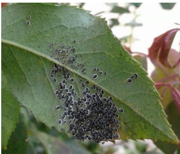
Figura 2 - Caratteristiche neanidi di IV stadio

Le forme giovanili di Aleurocanthus spiniferus si alimentano con la linfa contenuta nelle foglie per cui le punture dell'insetto provocano danni e debilitazione della pianta.