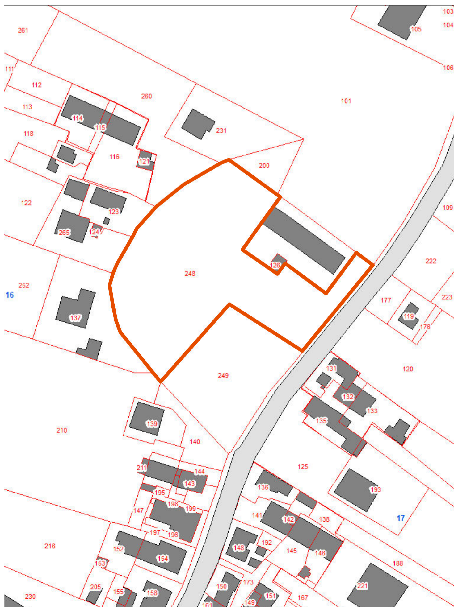
0 12,5 25 50 75 100 Meters