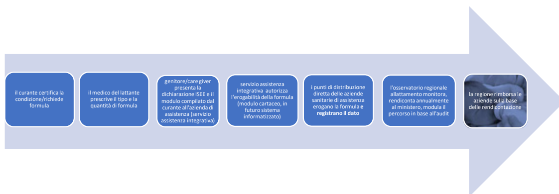
Figura 1. Sintesi del percorso

In aggiunta al sopra descritto monitoraggio dell'erogazione prevista dal Decreto Ministeriale del 31 agosto 2021, si richiede al servizio assistenza integrativa aziendale di erogazione di fornire all' Osservatorio Regionale Allattamento , sempre con cadenza semestrale, anche i dati aggregati relativi al numero di autorizzazioni all'erogazione gratuita dei sostituti del latte materno ai sensi del Decreto Ministeriale 8 giugno 2001 (decreto Veronesi) e la relativa quantificazione economica.