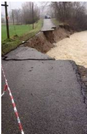
Gropparello – T. Riglio, strada comunale di Veggiola

Regione Emilia-Romagna Piano dei primi interventi urgenti di protezione civile del territorio regionale Ordinanza del Capo Dipartimento di Protezione Civile n. 351 del 3 giugno 2016