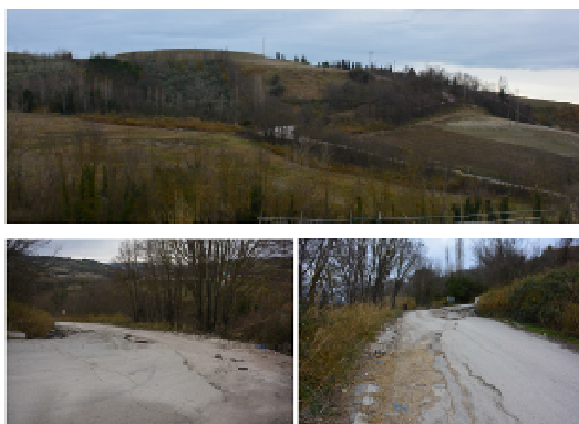
Comune di Coriano- Via Ranco loc. Mulazzano

Si è riattivato un dissesto che ha interessato la strada comunale Via Ranco (loc. Mulazzano), interdetta al transito.