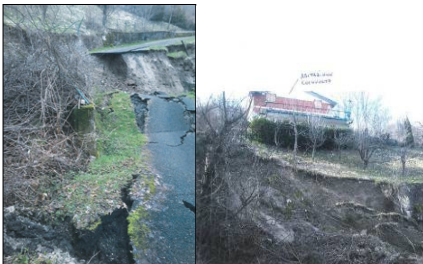
Comune di Coli – S.C. Rampa-Ruei

Regione Emilia-Romagna Piano dei primi interventi urgenti di protezione civile del territorio regionale Ordinanza del Capo Dipartimento di Protezione Civile n. 351 del 3 giugno 2016