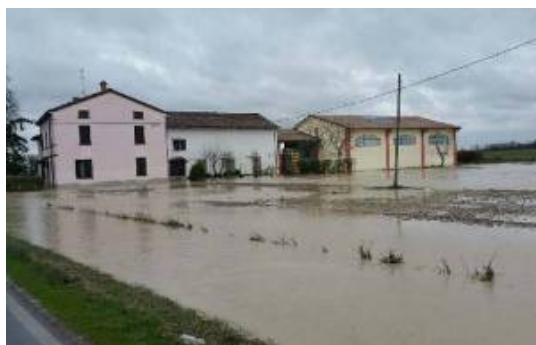
Torrente Arda a San Martino in Olza

Il torrente Chiavenna ha provocato diffuse esondazioni, con conseguenti allagamenti e chiusure di tratti stradali, danni alle opere di difesa idraulica, depositi di materiali in alveo e occlusioni parziale di sezioni di alveo, erosioni spondali, allagamenti di spazi pubblici. Interessate le località Chiavenna Landi di Cortemaggiore, La Chiusa, Saliceto e Rovoleto, Fontana Fredda, in comune di Cadeo; interessate alcune strade comunali del comune di Lugagnano e del comune di Castell'Arquato.