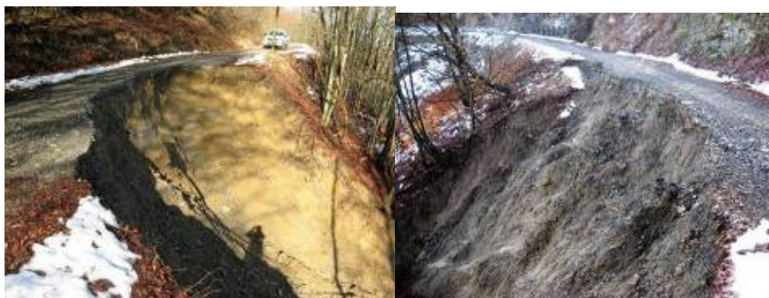
Farini: dissesti sulle strade di Pradalbora e Querciaccia

Sempre a causa di dissesti sono state interrotte le strade comunali per le frazioni Predalbora e Querciaccia con n. 2 isolamenti (1 persona a Predalbora e 1 persona a Querciaccia). E' stato effettuato un intervento del comune per il ripristino del transito mediante allargamento della carreggiata sul lato monte.