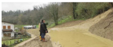
Comune di Dovadola – Le Trove