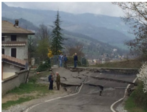
Bettola- frana in loc. Pergalla che interessa la SP 15 ed alcune abitazioni

In comune di Bettola, loc. Pergalla, il 26 marzo una frana di 400 metri di lunghezza, 300 di larghezza e alcune decine di metri di profondità ha interessato la SP 15 e alcune abitazioni. Risultano inagibili e severamente danneggiate diverse strutture abitative e ad uso agricolo, la necessaria conseguente chiusura della SP è causa di gravissime difficoltà di comunicazione delle frazioni interessate.