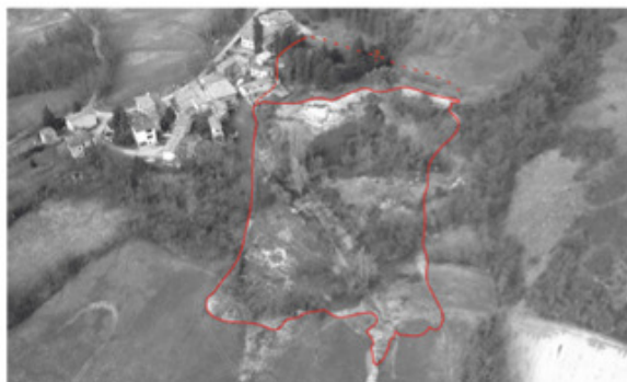
Comune di Traversetolo – frana di Gavazzo

Si è verificato l'aggravamento delle condizioni d'instabilità della pendice su cui sorge l'abitato di Gavazzo, con un'accelerazione dei movimenti registrati dalla rete di monitoraggio da 0,2 mm/giorno (1 Gennaio - 27 Febbraio) sino a 2,0 mm/giorno attuali. La frana interessa direttamente il centro abitato, la viabilità, un elettrodotto e il T. Termina