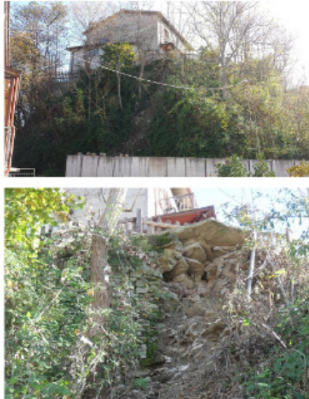
Comune di Sant'Agata Feltria- loc. San Donato

Regione Emilia-Romagna Piano dei primi interventi urgenti di protezione civile del territorio regionale Ordinanza del Capo Dipartimento di Protezione Civile n. 351 del 3 giugno 2016