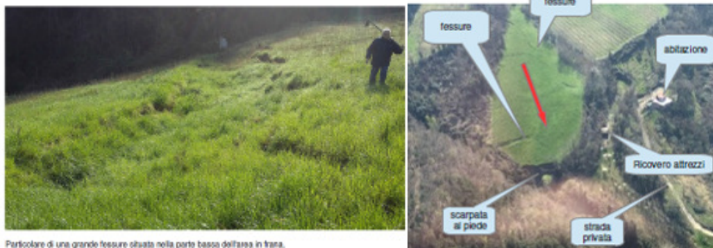
Particolare di una grande fessura situata nella parte bassa dell'area in frana.

Si è inoltre manifestata una frana di scivolamento traslativo (frana di Meleto) in località Ronchi, probabilmente attivata in corrispondenza di un interstrato marnoso, con una scarpata di distacco a monte e una serie di crepaccature. Il dissesto si sviluppa per blocchi fino al piede dove lo scivolamento di materiale detritico si riversa nell'alveo del rio.