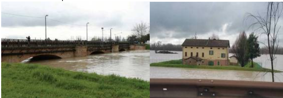
Fiume Secchia a Ponte Alto

Sono stati chiusi i ponti sul fiume Secchia e sul fiume Panaro.