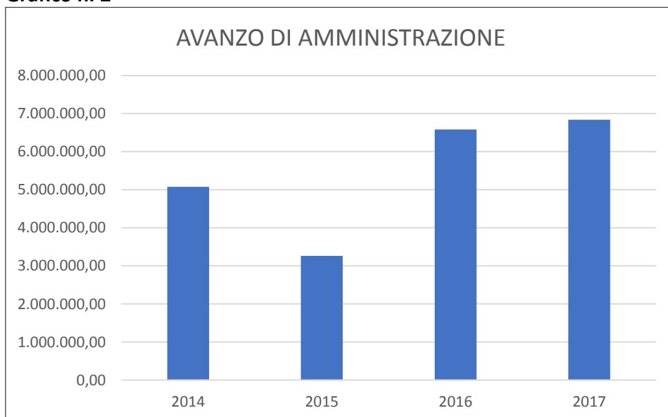
Grafico n. 2