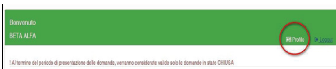
Figura 13 - Modifica-Visualizzazione del Profilo

Un messaggio invita a controllare i dati del Profilo e, nel caso sia la prima domanda che viene compilata dopo la registrazione, un messaggio invita a completare i dati del Profilo per poter proseguire nella compilazione della domanda.