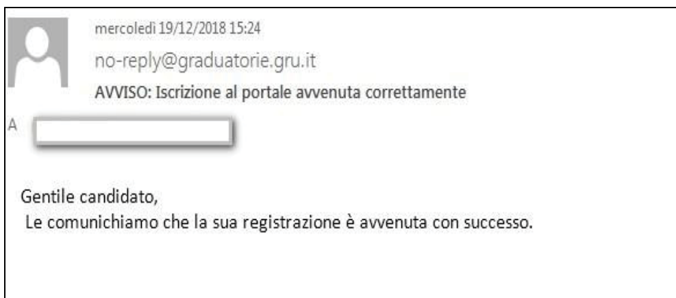
Figura 4 - Avviso mail di avvenuta registrazione