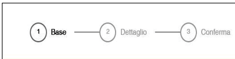
Figura 11 - Sezioni di compilazione della domanda

La domanda si articola in 3 sezioni di compilazione: Base, Dettaglio e Conferma