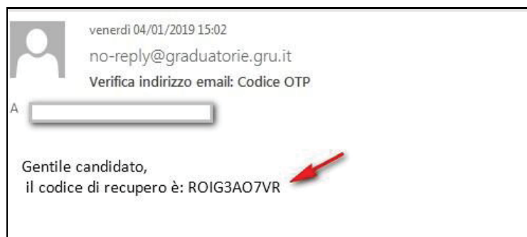
Figura 7 - invio codice OTP