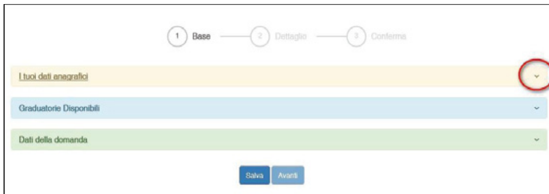
Figura 12 - Sezione Base

ogni sottosezione si espande cliccando sulla freccia a destra.